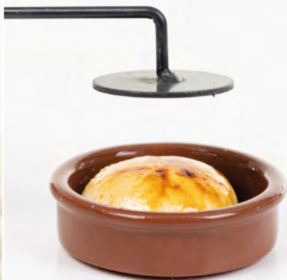
Esferificación de crema catalana / Crème brûlée spherification