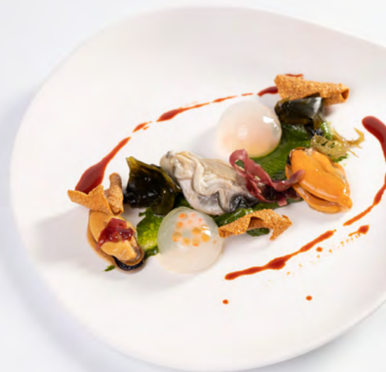
Esferificación de agua de mar con huevas de salmón / Seawater spherification with salmon roe