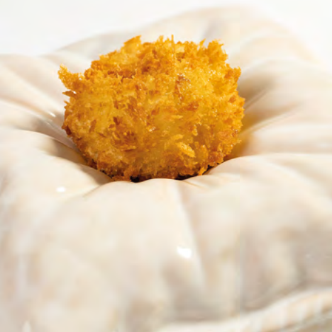
Esferificación frita de jamón (falsa croqueta) / Fried ham spherification (fake croquette)