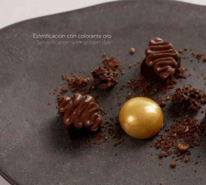
Esferificación con colorante oro / Spherification with golden dye